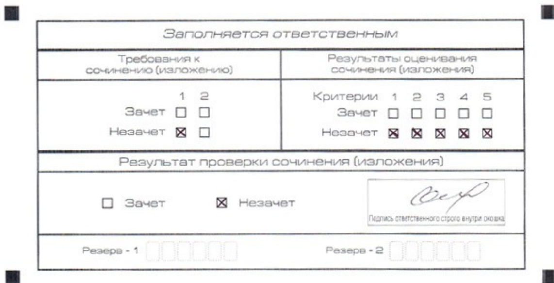
Рис. 5. Область для оценки работы

Эксперт комиссии (ответственное лицо) выставляет «незачет» за невыполнение требования № 2. В клетки по всем пяти критериям оценивания выставляется «незачет». В поле «Результат проверки сочинения (изложения) ставится «незачет».