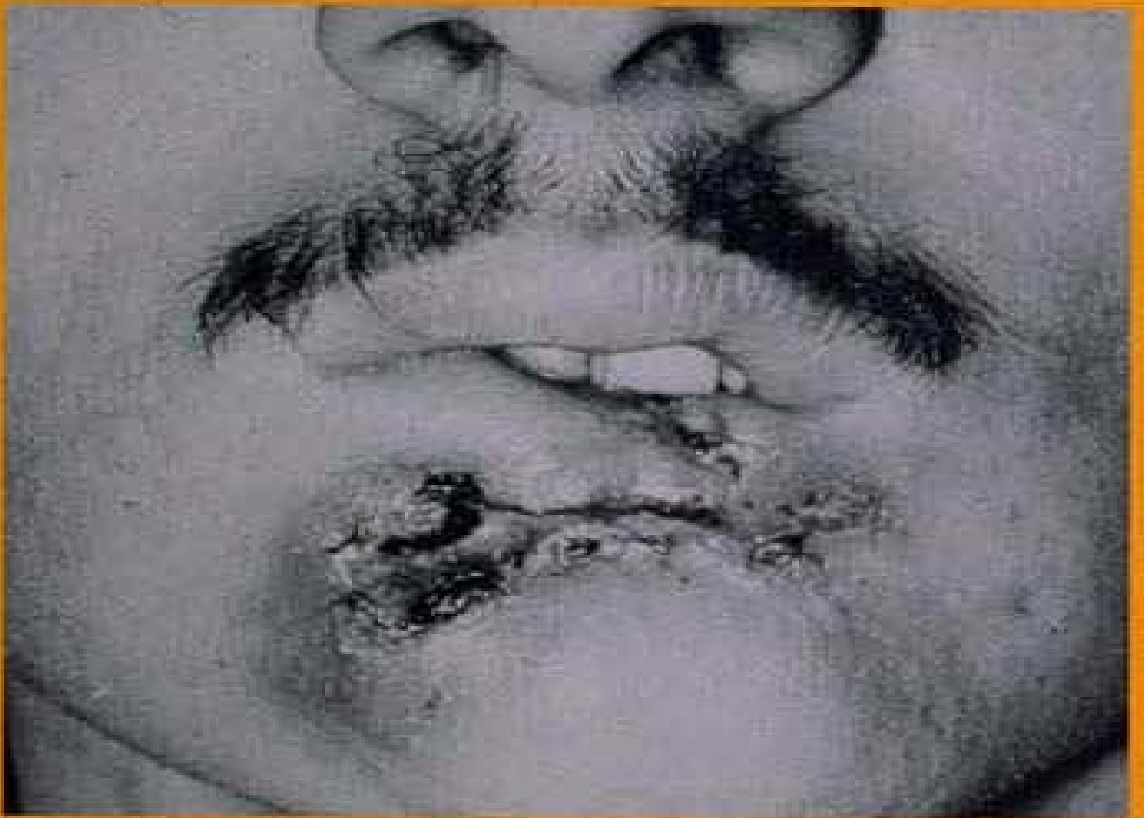
A fatal mouth cancer in a 28-year-old who dipped a can a day for 10 years.